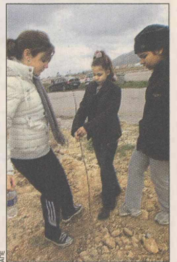
Μαθητές και δάσκαλοι συμμετείχαν σε δενδροφύτευση στο πρώην ανατολικό αεροδρόμιο.

μιλώντας στην «Κ», υποστηρίζει ότι «το σύνολο του χώρου πρέπει να γίνει πάρκο υψηλού πρασίνου με ήπιες πολιτιστικές και αθλητικές χρήσεις, χωρίς πολεοδόμηση για κατοικίες και εμπορικά κέντρα». Εξηγώντας την πρόταση των δημάρχων, ο κ. Κορτζίδης υποστηρίζει ότι θα μπορούσε να αξιοποιηθεί το υπάρχον δομημένο τμήμα του χώρου όπου «κάποια από τα υπάρχοντα κτίρια θα μπορούσαν να γκρεμιστούν, προκειμένου να αντικατασταθούν από σύγχρονα. Σε κάθε περίπτωση, όμως, να μην κατασκευαστούν τα μεγαθήρια που επαγγέλλεται το υπουργείο».