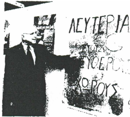
■ Ο επίτροπος Περιβάλλοντος Σταύρος Δίμας μιλάει στο Φόρουμ για το Μητροπολιτικό Πάρκο, το οποίο διοργάνωσαν οι Δήμοι Ελληνικού, Αλίμου, Αργυρούπολης και Γλυφάδας