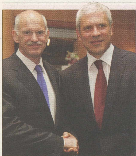
Ο Γιώργος Παπανδρέου με τον πρόεδρο της Δημοκρατίας της Σερβίας Μπόρις Τάντικ στο Οσλο