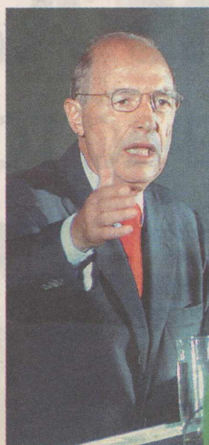
▲ ΔΡΙΜΥ «ΚΑΤΗΓΩΡΩ» από τον Κ. Σημίτη κατά της ΝΔ για την απόφασή της να διερευνηθούν τυχόν ευθύνες του σχετικά με την υπόθεση Siemens

Ολομέτωπη επίθεση στη ΝΔ, για την απόφασή της να διερευνηθούν τυχόν ευθύνες του σχετικά με την υπόθεση της Siemens, εξαπέλυσε χθες με γραπτή του δήλωση ο Κ. Σημίτης, ο οποίος, ωστόσο, προέβη σε αυτοκριτική για τις επιλογές των τότε συνεργατών του λέγοντας ότι «δεν ήταν όλες επιτυχημένες», ενώ ξεκαθάρισε ότι «ποτέ δεν δόθηκε εντολή για προνομιακή συμπεριφορά υπέρ κάποιας εταιρείας ή για οποιοδήποτε συναλλαγές». Ο πρώην πρωθυπουργός, εν όψει και της σημερινής συζήτησης του πορίσματος της εξεταστικής επιτροπής στην Ολομέλεια