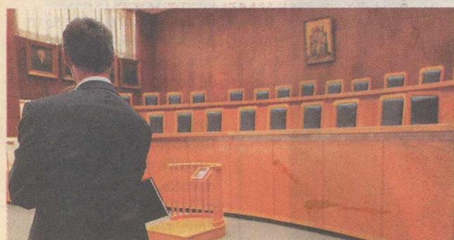
▲ ΑΛΛΑΓΕΣ σε ένα μήνα στο επάγγελμα των δικηγόρων