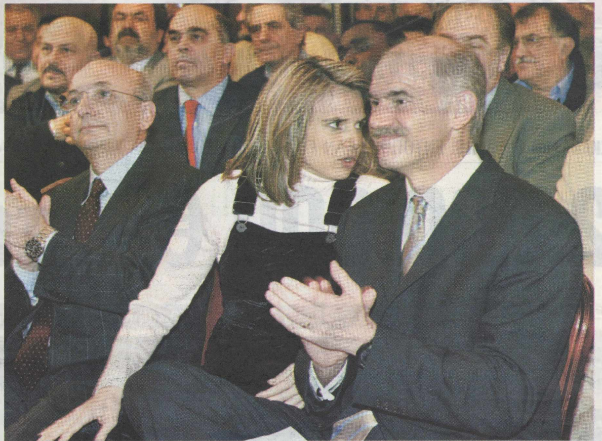
«Κύριε, αυτός δίπλα μου ρωτάει αν θέλουμε κουπόνια σε μάρκα».

Η ΤΙΜΗ του πολιτικού κόσμου όταν ανταλλάσσεται από μερικrύς με τίμημα, σε μάρκα ή σε ευρώ, δεν μπορεί να προστατευθεί από τη Δικαιοσύνη. Οι ίδιοι οι πολιτικοί πρέπει να προσπαθήσουν να τη διασώσουν συλλογικά και διακομματικά. Στη Βουλή.