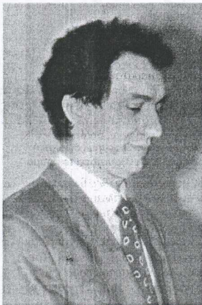
Φορολογικές δηλώσεις ζήτησε ο εισαγγελέας από τον κ. Τραπεκλή γιατί η αμοιβή του τού φάνηκε υπέργοχη

Όσο για τον πάλι ποτέ στρατηγό της Χαρ. Τρικούπη, Θ. Τσουκάτο, αναμένεται να ζητήσει σήμερα από τον εισαγγελέα Αθανασίου προθεσμία, προκειμένου να παράσχει τις εξηγή-