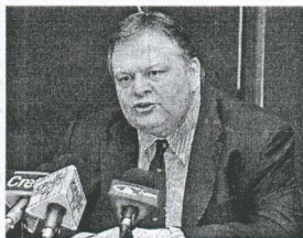
Η πρόταση Βενιζέλου για εσωτερική Εξεταστική δεν ενθουσιάζει το κόμμα

Αφήνουν να εννοηθεί ότι είναι πολύ πιθανό να κρύβεται πίσω απ' όλα αυτά κι ένας δάκτυλος της Ν.Δ., που ελέγχει τη διαρροή πληροφo-