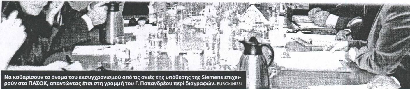
Να καθαρίσουν το όνομα του εκσυγχρονισμού από τις σκιές της υπόθεσης της Siemens επιχειρούν στο ΠΑΣΟΚ, απαντώντας έτσι στη γραμμή του Γ. Παπανδρέου περί διαγραφών.