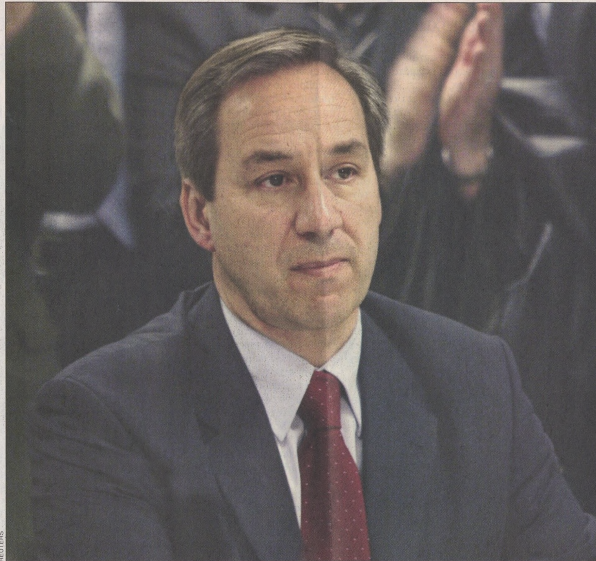
«Δεν τα παρατάω στα δύσκολα», λέει ο κ. Γ. Αλογοσκούφης και τονίζει ότι θα παραμείνει στο υπουργείο Οικονομίας έως ότου ολοκληρώσει όσα έχει σχεδιάσει και τα οποία, όπως σημειώνει, έχουν ορίζοντα 4ετίας.

Η οικονομική πολιτική έπαψε να θεωρείται το ισχυρό χαρτί της κυβέρνησης και οι επικρίσεις για τον κ. Αλογοσκούφη πληθαίνουν. Του καταλογίζουν: