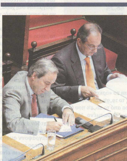
Ρε Αλογοσκούφη, τι είναι αυτά που γράφει ο Ζορμπάς;

Λένε ότι στην πολιτική δεν υπάρχουν αδιέξοδα ή ότι το κενό, αν υπάρχει, θα το καλύψει η φύση. Στη θεωρία έτσι είναι. Ομως, επειδή μια χώρα δεν κυβερνιέται μόνο με θεωρίες, το πολιτικό της σύστημα -αυτό που έχουμε μέχρι να βρούμε άλλο- καλείται ν' αντιδράσει. Να ξεπεράσει τη φάση των σκανδάλων και της σκανδαλολογίας (όχι να αγνοήσει και να θάψει δυσώδεις υποθέσεις, αλλά να αντιμετωπίσει κατάματα το πρόβλημα) και να αντικρίσει και τα άλλα προβλήματα, που ήρθαν και έρχονται απειλητικότερα.