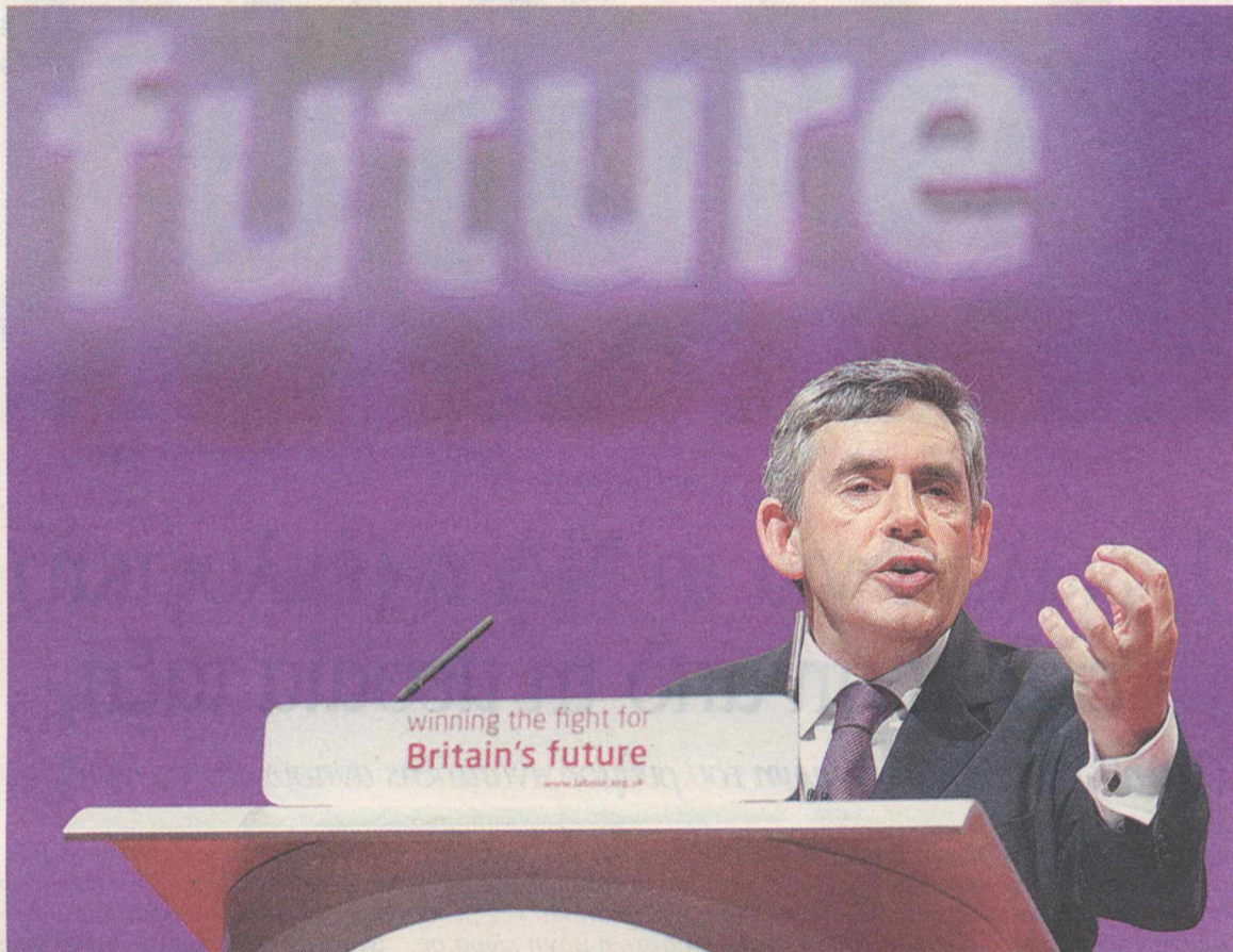
Ο βρετανός πρωθυπουργός Γκόρντον Μπράουν στο βήμα του συνεδρίου του Εργατικού Κόμματος, στις 23 Σεπτεμβρίου

Το τραπεζικό σύστημα είναι το θεμέλιο για ό,τι κάνουμε. Κάθε οικογένεια και κάθε επιχείρηση στη Βρετανία βασίζεται σε αυτό. Αυτός είναι ο λόγος που όταν απειληθήκαμε από την παγκόσμια οικονομική κρίση, που ξεκίνησε στις ΗΠΑ και έχει τώρα εξαπλωθεί σε ολόκληρο τον πλανήτη, εμείς, στη Βρετανία, αναλάβαμε δράση για να διασφαλίσουμε τις τράπεζες και το χρηματοοικονομικό μας σύστημα.