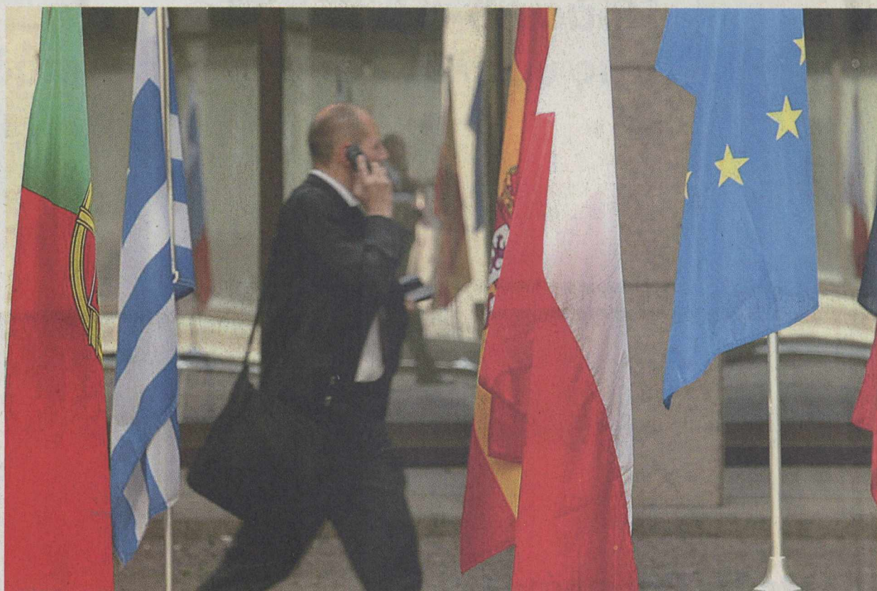
Η Eurostat ήταν ενημερωμένη για όλες τις κινήσεις της ελληνικής κυβέρνησης για τα swars.

Βεβαίως, swars δεν έκανε μόνο η Ελλάδα, ούτε τα έκανε αποκλειστικά με την Goldman Sachs. Και φυσικά δεν ήταν άγνωστα. Όχι μόνο στη σχετικά κλειστή κοινότητα των τραπεζικών στελεχών που ασχολούνται με σύνθετα χρηματοοικονομικά