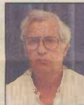
• Άρθρο του ΧΡΗΣΤΟΥ ΘΕΟΧΑΡΑΤΟΥ

Αν ο λαός δεν αλλάξει, ας μην αιπιάται τα κόμματα, το σύστημα τα συνδικάτα και τα ΜΜΕ. Ας αιπιάται πρωτίστως τον εαυτό του και μετά όλα τα άλλα. Διότι, χωρίς αλλαγή του υποκειμένου της Δημοκρατίας -του λαού- αλλαγή δεν πρόκειται να υπάρξει!