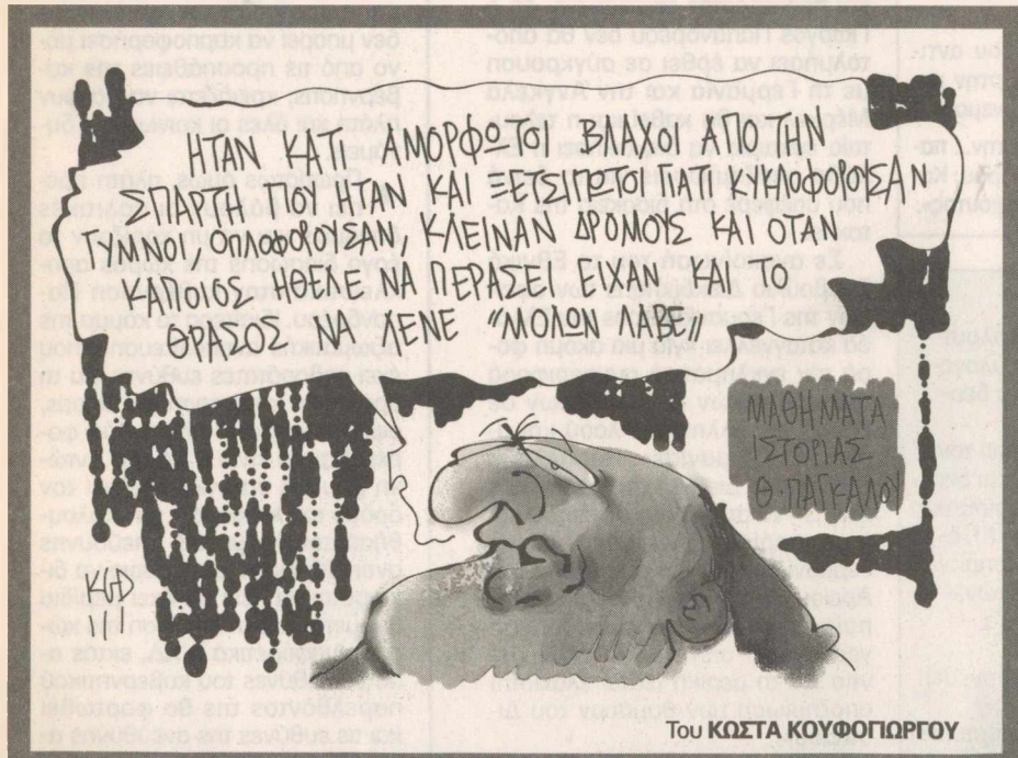
Του ΚΩΣΤΑ ΚΟΥΦΟΠΩΡΓΟΥ