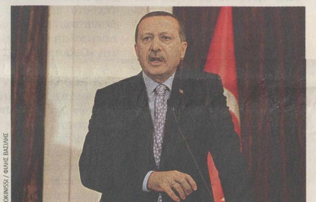
Ο κ. Ταγίπ Ερντογάν δήλωσε σε δημοσιογράφους ότι αφιενδιάστηκε από τις αναφορές του Έλληνα πρωθυπουργού.

πουργός Εθνικής Άμυνας δήλωσε (ΣΚΑΙ) ότι «κατά καιρούς με ενόχλούν οι δηλώσεις του αντιπρόεδρου». Εκτίμησε μάλιστα ο κ. Μπεγλίτης ότι ο κ. Πάγκαλος εκπέμπει έναν καταγγελλτικό λόγο, «ο οποίος δεν συμβάλλει στο να λύσουμε προβλήματα στη δημόσια διοίκηση», ενώ -όπως έκρινε- «δεν βοηθά την κυβέρνηση». Εν τω μεταξύ, σε επίπεδο κόμματος, μέχρι και την απομπή του κ. Πάγκαλου ζήτη η Αριστερή Πρωτοβουλία (Γ. Παπαγιωτακόπουλος). Τέλος, ως ευρισκόμενο εκτός γραμμής τοποθετούν κύκλοι του Μεγάρου Μαξίμου τον κ. Ευ. Βενιζέλο, ο οποίος την τελευταία εβδομάδα διά της αρθρογραφίας του έχει εκφράσει διαφορετικά άποψη για κρίσιμα ζητήματα, όπως ο εκλογικός νόμος. Β. Ν.