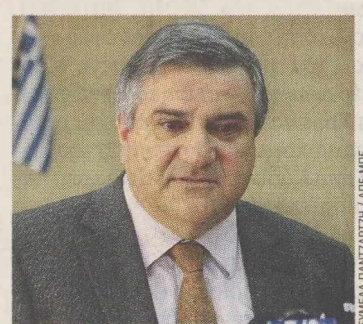
Ο κ. Χ. Καστανίδης συναντήθηκε με εκπροσώπους δικηγόρων και συμβολαιογράφων.

Σημειώνεται ότι σε εξέλιξη βρίσκονται και οι διαβουλεύσεις του υπουργού Υποδομών κ. Δημ. Ρέππα με τους πολιτικούς μηχανικούς. Πάντως, οι αρμόδιοι υπουργοί δεν λειτουργούν υπό πίεση χρόνου για την ολοκλήρωση των διαπραγματεύσεων με τους επί μέρους κλάδους, καθώς για την ολοκλήρωσή τους υπάρχει περιθώριο ερισ τριμήνου. Αντιθέτως, το νομοσχέδιο «ομπρέλα» του κ. Γ. Παπακωνσταντίνου για τη κλειστή επαγγέλματα θα πρέπει να κατατεθεί μέχρι το τέλος του μήνα. Φ.Κ.