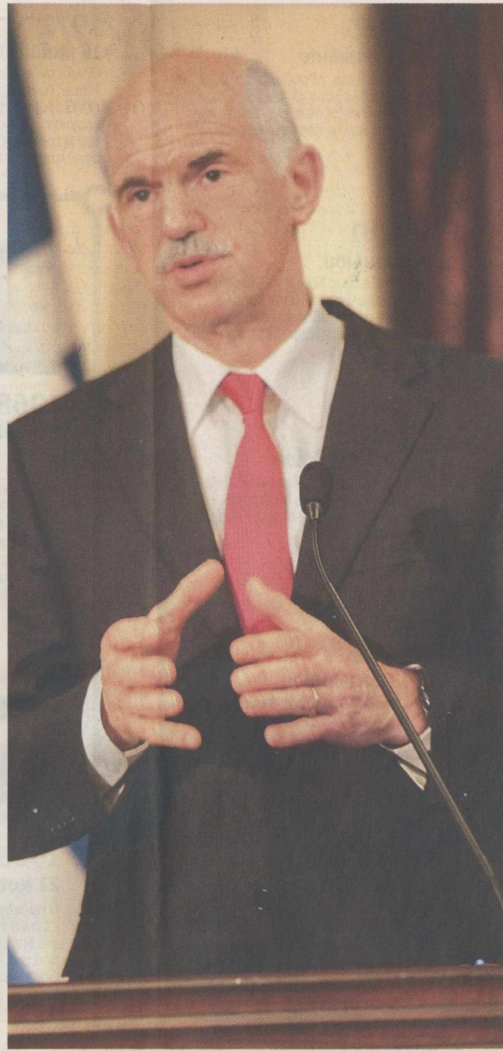
Ο πρωθυπουργός προτίθεται να συγκαλέσει την Κ.Ο. του ΠΑΣΟΚ μετά το Εκοφιν, που είναι προγραμματισμένο για τις 16 Ιανουαρίου.

Εν τω μεταξύ, στο εσωτερικό της Κ.Ο. φαίνεται ότι αρκετοί βουλευτές δεν παύουν να εκδηλώνουν οργανωμένα τη δυσφορία τους για ορισμένες κυβερνητικές πρωτοβουλίες. Είναι ενδεικτικό το παράδειγμα της χθεσινής κατάθεσης ερώτησης από 16 βουλευτές του ΠΑΣΟΚ για τη μείωση της ψαλίδας των τιμών ανάμεσα στον παραγωγό και στον καταναλωτή. Παν ερώτηση υπογράφουν οι κ.κ. Οδ. Κωνσταντινόπουλος, Μ. Κατρίνης, Κ. Καρατάλης, Θ. Οικονόμου, Ν. Σαλαγιάννης, Λ. Γρηγοράκος, Νάντια Γιαννακοπούλου, Κ. Σπυλιόπουλος, Εκτ. Νασιάκας κ.ά.