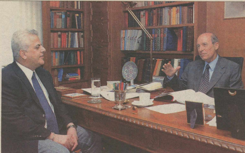
«Ο ΛΑΟΣ δεν διαφέρει ουσιαστικά από τη Νέα Δημοκρατία και έμμεσα ή άμεσα θα στηρίξει μια κοινή προσπάθεια της Δεξιάς», επισημαίνει ο Κώστας Σημίτης.

ΤΟ ΔΙΛΗΜΜΑ των εκλογών είναι αν θα προχωρήσει το σύνολο της κοινωνίας με το ΠΑΣΟΚ σε μια πορεία που θα μας επιτρέψει να στεκόμαστε στα πόδια μας με ασφάλεια και βέβαιη ελπίδα περισσότερης ευημερίας ή αν θα συνεχίσουμε να διαχειριζόμαστε με τη Νέα Δημοκρατία απλώς το σήμερα, διολισθαίνοντας στο χτες και υπονομεύοντας τα συλλογικά και ατομικά συμφέροντά μας.