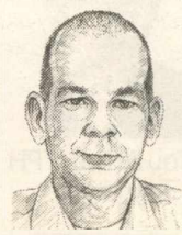
Του ΓΕΩΡΓΙΟΥ Π. ΜΑΛΟΥΧΟΥ

Συμβούλιο κ.ο.κ. Επιπλέον, κι αυτό είναι το πιο εντυπωσιακό, ο κ. Σημίτης επέμενε να αγνοεί το απολύτως αυτονόητο: ότι η ένταξη ακόμα κι αν μπορούσε, που δεν θα μπορούσε ποτέ, να ολοκληρωθεί ως διαδικασία στις Βρυξέλλες, αναμφίβολα θα μπλόκαρε σε κάποιο δημοψήφισμα ή σε κάποιο κοινοβούλιο την ώρα της κύρωσης -κι αν αυτό γινόταν την τελευταία στιγμή