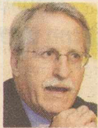
Του ΠΑΝΑΓΙΩΤΗ Κ. ΙΩΑΚΕΙΜΙΔΗ*

Αλλήλωσε, όλη αυτή η συζήτηση για «ευρωπαϊκή λύση» ερμηνεύεται ως προσπάθεια απόρριψης της ομοσπονδίας. Παράλληλα, προβάλλεται εντονότερα τελευταία η θέση ότι τόσο για το Κυπριακό όσο και για τα ελληνοτουρκικά «ο χρόνος εργάζεται υπέρ των ελληνικών απόψεων και συμφερόντων». Πρόκειται βεβαίως για κολοσοσιαίο ρήθος. Ο