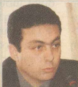
Του ΧΡΗΣΤΟΥ ΙΑΚΩΒΟΥ *

Η μόνη σίγουρη εξέλιξη, πλην όμως ιδιαίτερα ανησυχιακή για την Τουρκία, είναι η πιθανότητα ανάδειξης μιας ισχυρής αυτόνομης ή ομοσπονδιακής κουρδικής οντότητας ή και ενός ανε-