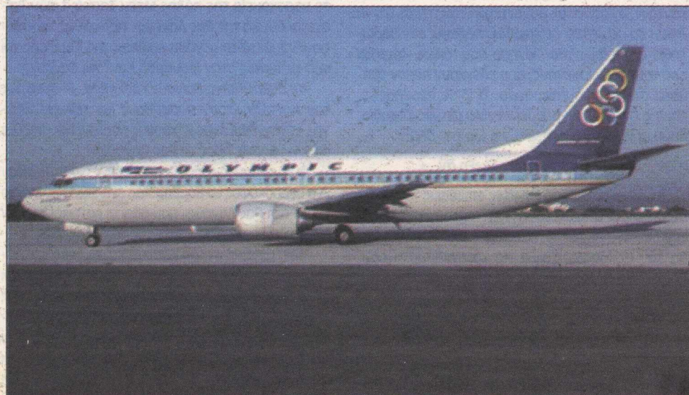
Οι αυξήσεις στους μισθούς και ο μεγάλος αριθμός εργαζομένων ακύρωναν το πρόγραμμα εξυγίανσης της «Ολυμπιακής»