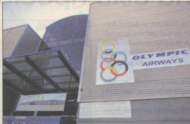
«Χρυσό μισθό» σε ΔΕΠ, Ολυμπιακή, ΔΕΗ, ΟΤΕ