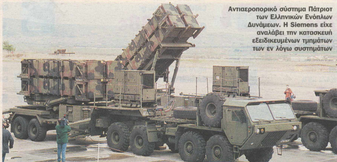
Αντιαεροπορικό σύστημα Πάτριος των Ελληνικών Ενόπλων Δυνάμεων. Η Siemens είχε αναλάβει την κατασκευή εξειδικευμένων τμημάτων των εν λόγω συστημάτων

Σε ό,τι αφορά την υπόθεση του ΟΣΕ, η συνεργασία του ελληνικού Δημοσίου με τη Siemens ξεκίνησε με προ-