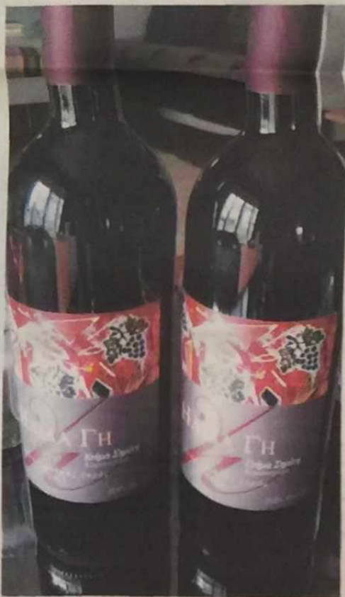
ΤΟ ΚΡΑΣΙ «Ελλάδα γη» με την ετικέτα που φέρει το όνομα του πρώην πρωθυπουργού

Εκτός το Κορακοχώρι είναι σημείο αναφοράς για την οικογένεια Σημίτη, που περνάει εκεί τις διακοπές της δύο φορές τον χρόνο. Τέλη Αυγούστου, μετά την επιστροφή από τα νησιά, και τον Γενάρη, συνήθως στις Αλκυονίδες μέρες. Το κτήμα στο Κορακοχώρι έχει αποκτήσει μεγάλη