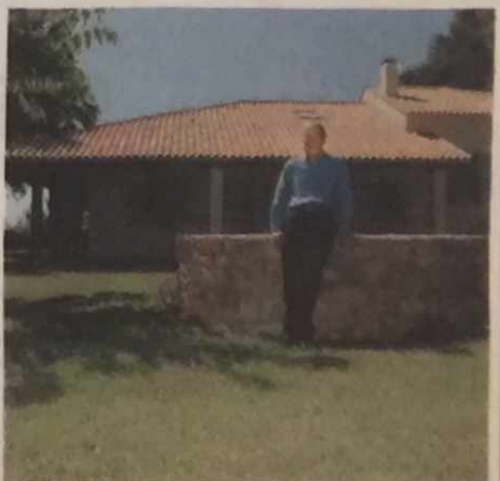
ΤΟ ΣΠΥΤΙ στο Κορακοχώρι αποτελεί εδώ και χρόνια σημείο αναφοράς για την οικογένεια Σημίτη

συμβολική σημασία για τον πρώην πρωθυπουργό, αφού εκεί έδωσε την πρώτη συνέντευξή του μετά την απόσυρσή του από την ενεργό πολιτική το 2004 και τη μεταβίβαση της ηγεσίας του ΠΑΣΟΚ στον κ. Παπανδρέου.