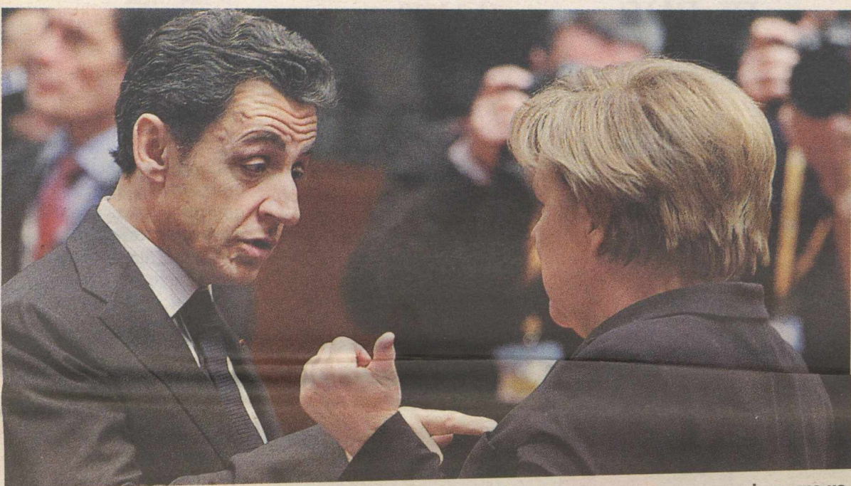
Νικολά Σαρκοζί και Ανγκελα Μέρκελ στο Ευρωπαϊκό Συμβούλιο του Δεκεμβρίου. Στις προσυνεννοήσεις της με άλλους ευρωπαίους ηγέτες η γερμανίδα καγκελάριος φρόντισε να κλείσει τη συζήτηση για το ευρωμολόγο

θα πρέπει να αναλάβει το βάρος της διάσωσης όσων χωρών κινδυνεύουν. Όμως σε μια κατάσταση όπως η σημερινή, όπου οι χώρες του Νότου αυξάνουν ταχύτητα το δημόσιο χρέος τους, πληρώνουν επιτόκια, τα οποία είναι τόσο υψηλά ώστε καθιστούν αμφίβολη την αποπληρωμή των δανείων τους, και επικρατεί σε αυτές ύφεση ή στασιμότητα, οι χώρες του Βορρά δεν θέλουν να αναλάβουν υποχρεώσεις που κινδυνεύουν να τις παρασύρουν στη δίνη της κρίσης του Νότου. Είναι πρόθυμες να παράσχουν βοήθεια μόνο εφόσον παίρνονται ταυτόχρονα τα απαραίτητα μέτρα για να παραμένουν κατ' αυτές διαχειρίσιμη η κρίση και πιθανή η επάνοδος στην ομαλότητα. Ο μόνιμος μηχανισμός σταθεροποίησης, που συμφωνήθηκε στη Σύνοδο Κορυφής, ανταποκρίνεται ακριβώς σε αυτή την απαίτηση.