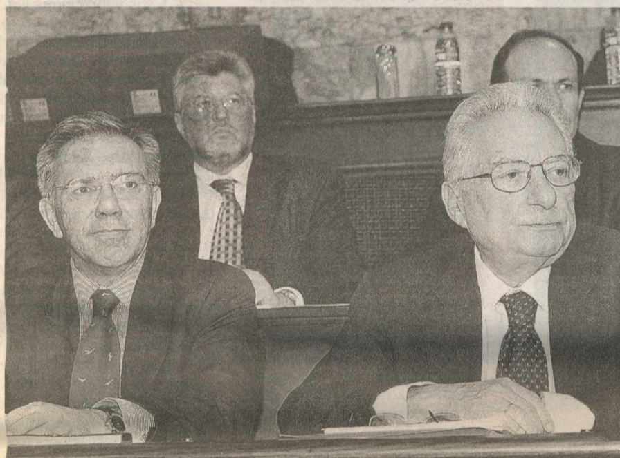
Ο υπουργός Εξωτερικών κ. Π. Μολυβιάτης (δεξιά) με τον αναπληρωτή υπουργό Εξωτερικών κ. Ι. Βαλινάκη στη χθεσινή συζήτηση στην Επιτροπή της Βουλής