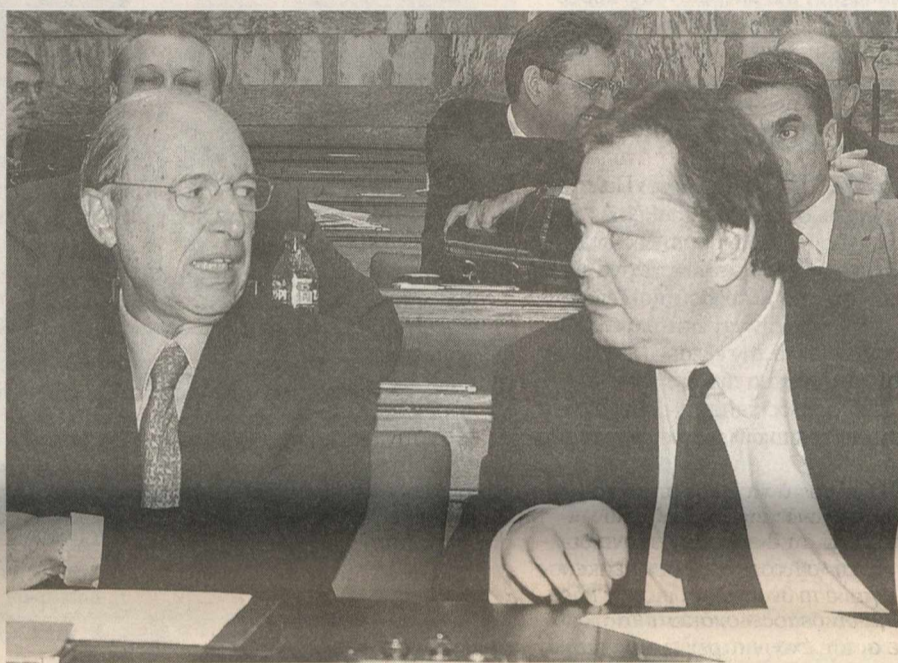
Ο πρώην πρωθυπουργός κ. Κ. Σημίτης (αριστερά) και ο κ. Ευ. Βενιζέλος συνομιλούν προτού αρχίσει η συνεδρίαση της Διαρκούς Επιτροπής Εξωτερικών και Αμυνας