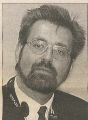
Κόλαφος για τον Κ. Σημίτη είναι η επιστολή του γενικού διευθυντή της Eurostat Γκίντερ Χάνραϊχ (αριστερά), στους «Φαϊνάνσιαλ Τάιμς».

Μάλιστα, από την επιστολή του κ. Χάνραϊχ, προκύπτει ότι ο κ. Σημίτης και η κυβέρνησή του παρουσίαζαν ψευδή στοιχεία για τις αμ-