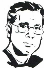
Από τον Δημήτρη Μιτρόπουλο

Επρόκειτο για πολιτική κατάρρευση. Ακόμη χειρότερα: η διακυβέρνηση Καραμανλή επιδόθηκε σε μία απόπειρα συστηματικής αποδόμησης της οκταετίας Σημίτη. Ακόμη και το «πετράδι του εκσυγχρονισμού», η ΟΝΕ, αμφισβητήθηκε εξαιτίας της δημοσιονομικής απογραφής Αλογοσκούφη. Ο ίδιος ο Παπανδρέου δεν έκανε μεγάλες προσπάθειες να υπερασπίσει τη διακυβέρνηση Σημίτη. Κάποια πρόσωπα στο επιτελείο του τη δαιμονοποίησαν, για να μη χρωθεί ο νέος αρχηγός τις δύο απανωτές ήττες. Η νέα ηγεσία περιθωριοποίησε και τα περισσότερα