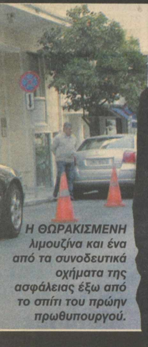
Η ΘΩΡΑΚΙΣΜΕΝΗ λιμουζίνα και ένα από τα συνοδευτικά οχήματα της ασφάλειας έξω από το σπίτι του πρώην πρωθυπουργού.