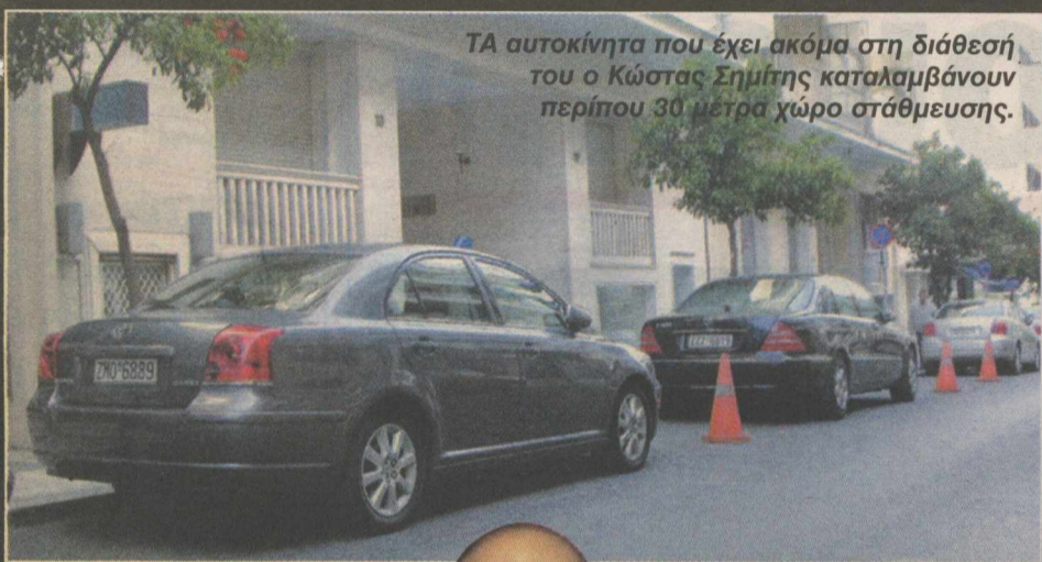
ΤΑ αυτοκίνητα που έχει ακόμα στη διάθεσή του ο Κώστας Σημίτης καταλαμβάνουν περίπου 30 μέτρα χώρο στάθμευσης.