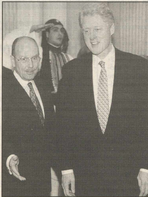
Από τις ελληνικές ικεσίες προς τον τότε πρόεδρο Κλίντον, το '94, για μια δήλωση περί τα ελληνοτουρκικά, στην παρέμβαση Στεφανόπουλου, που έδωσε το ερέθισμα να εσπανίσει η Χάγη στο προσκήνιο

Ετσι, εκτιμάται πως «επιστρατεύτηκε» ο υψηλής αποδοχής στην κοινή γνώμη τέως Πρόεδρος της Δημοκρατίας Κ. Στεφανόπουλος για να δώσει ένα «ερέθισμα» στις σχέσεις της χώρας με τη γείτονα με το οποίο, μεν, παρέπεμψε συλλήβδην όλα τα θέματα στην «εύκολη λύση» της Χάγης, αλλά παράλληλα απεφάνθη πως «μετά τη συνολική επί όλων των θεμάτων απόφαση του Δικαστηρίου... τότε ρυθμιζόμενων οριστικώς των σχέσεών μας με την Τουρκία δεν θα υπάρξει περίπτωση πολέμου ούτε ο κίνδυνος εκ της, απέναντι των νήσων, πλευράς».