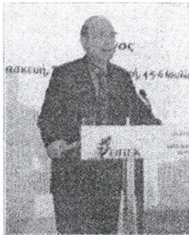
δημοψήφισμα για την έγκριση της νέας Συνθήκης της Ευρωπαϊκής Ένωσης απεφάσισαν την απόρριψή της.

αποσπάσματα από την ομιλία του πρώην πρωθυπουργού, στην πρώτη δημόσια εκδήλωση μετά τη διαγραφή του. Ο κ. Σημίτης είπε και αυτά: Το θέμα της σημερινής ομιλίας μου "Δημοκρατία και Διαφορετικότητα" αφορά στην Ευρωπαϊκή Ένωση. Στο τέλος θα αναφερθώ σε κάποιες πτυχές της ελληνικής πολιτικής ζωής. Ανέπτυξα το θέμα αυτό πρόσφατα στο Τορίνο της Επιτροπής Περιφερειών του Ευρωπαϊκού Σοσιαλιστικού Κόμματος. Είναι ένα θέμα εξαιρετικά επίκαιρο. Όλοι διαβάσαμε ότι πριν από λίγο οι Ιρλανδοί, κατά το