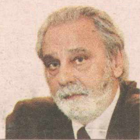
ΤΟΥ ΚΩΝΣΤΑΝΤΙΝΟΥ ΤΣΟΥΚΑΛΑ

Τ ο γεγονός ότι ένας άνθρωπος που ηγήθηκε μιας χώρας για οκτώ συναπτά χρόνια καταθέτει ενυπογράφως έναν λεπτομερή και σε πολλά σημεία εξονυχιστικό πολιτικό απολογισμό της διακυβέρνησής του δεν είναι ασφαλώς συνηθισμένο. Όπως εξίσου πρωτόφαντο, τουλάχιστον για τα ελληνικά δεδομένα, είναι η επιλογή μιας εν ενεργεία πολιτικής προσωπικότητας να μιλήσει για το μέλλον στο όνομα ενός παρελθόντος για το οποίο αναλαμβάνει και την πολιτική ευθύνη. Θα περίμενε λοιπόν κανείς ότι οι «αντιδράσεις» στο βιβλίο αυτό θα ήταν εξίσου ιστορικά και πολιτικά υπεύθυνες και ενυπόγραφες.