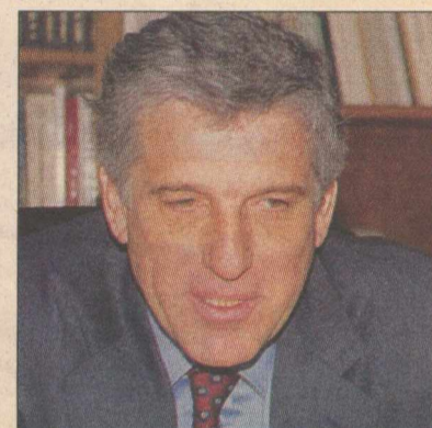
Γιάννος Παπαντωνίου. Εισηγείται σήμερα στον Πρωθυπουργό το πακέτο ελαφρύνσεων

φωνα με κύκλους του υπουργείου Οικονομικών, θα είναι μεγαλύτερη, αφού θα υπάρξουν και αναπροσαρμογές σε διάφορα επιδόματα.