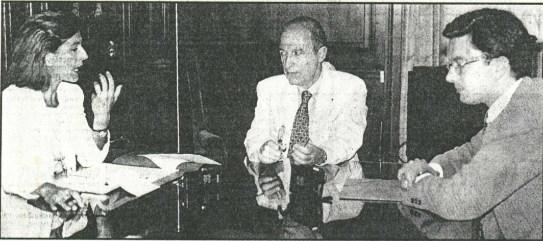
«Στον κ. Εφερτ του αρέσει να εμφανίζεται σαν μάγος με τα καθάρματα και να προσπαθεί να παραπλανήσει τους Έλληνες πολίτες. Να τους κρύψει το συντηρητικό πρόσωπο της ΝΔ», τόνισε ο πρωθυπουργός και πρόεδρος του ΠΑΣΟΚ Κ. Σημίτης στη συνέντευξή του στην Ολγα Τρέμη και στον Νίκο Χατζηνικολάου.