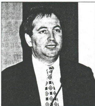
Ο κ. Daniel Franklin

« Η Ελλάδα καλύτερα να παραμείνει εκτός ΟΝΕ, παρά να εισέλθει και να μετανιώσει επ' όσον δεν είναι έτοιμη», είπε ο διευθυντής σύνταξης του «Economist Intelligence Unit» κ. Daniel Franklin σε ομιλία του στην Αθήνα ως επίσημος καλεσμένος της Τράπεζας Κύπρου. Σε ερώτησή μας για το αν, το πότε και το ποσοστό είναι πιθανή μια υποτίμηση του εθνικού μας νομίσματος, ο κ. Franklin μας απάντησε: «Εμείς, στον «Economist Intelligence Unit», πιστεύουμε ότι η δραχμή είναι υπερτιμημένη. Η σταθερή παρουσία του μεγάλου ελλείμματος τρεχουσών συναλλαγών, παρά τις σημαντικές εισροές από την Ευρωπαϊκή Ένωση, δείχνει με έμφαση ότι εάν η Ελλάδα πρόκειται να συμμετάσκει στην ΟΝΕ, οι Ευρωπαίοι εταίροι της θα θέλουν αυτό να γίνει με μια σταθερή συναλλαγματική ισοτιμία. Είναι πολύ πιθανό να επιμεινουν αυτή η ισοτιμία να είναι χαμηλότερη από τη σημερινή, παρα τη δημόσια δεσμεύση της ελληνικής κυβέρνησης για ισχυρή δραχμή. Επομένως μια μελλοντική υποτίμηση τον επόμενο χρόνο ή το 1999 κατά 10%-15% είναι κατά την άποψή μας πιθανή».