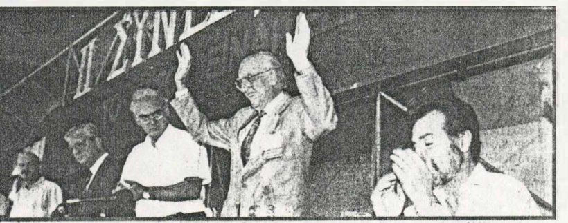
Χαιρετισμός του Ανδρέα χτες στη 2η μέρα του Συνεδρίου