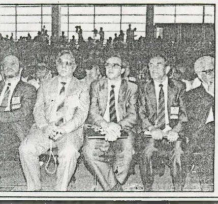
Σύμφωνα με ρεπορτάζ της «Νίκης», οι άνθρωποι της «τράικα» διαβίδουν ότι ελέγχουν πάνω από 700 συνέδρια και ότι μέσα αυτών μπορούν άνετα να ελεγχθούν τη νέα Κ.Ε. τράφουν οι συνέδρια αυτοί θα ψηφίσουν σαν «μπλοκ»

«Περιμένουμε να δούμε πως το Συνέδριο σας θα επεξεργαστεί τον τρόπο πραγμάτωσης του σημαντικού στόχου της ανασύστασης της Δ.Σ., που έθεσε ο πρόεδρος του ΠΑΣΟΚ στη χθεσινή (προχθεσινή) του ομιλία για τις εξελίξεις σε τόπο μας.»