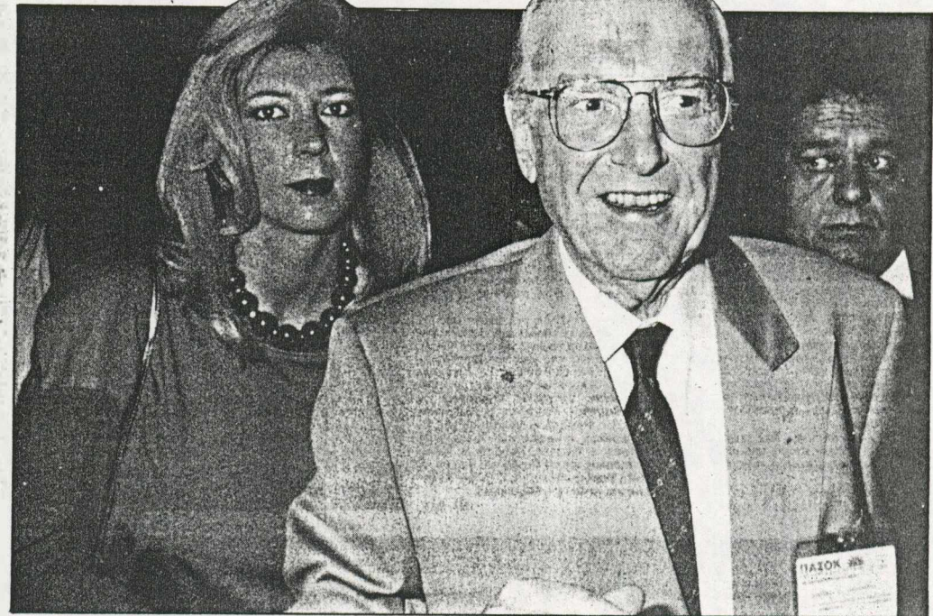
Ο πρόεδρος του ΠΑΣΟΚ Α. Παπανδρέου με τη σύζυγό του προσέρχονται στην αίθουσα του συνεδρίου.

Ο Α. Σαλαγιάννης είπε ότι θα υπερωφεί το κείμενο του