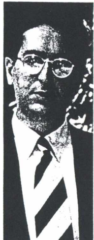
Τις διαφορές πρωθυπουργού και υπουργού ΠΕΧΩΔΕ κλήθηκε να γεφυρώσει ο υφυπουργός Νάσος Αλευράς.

Απρόβλεπτες ενδοκυβερνητικές τριβές σε πολύ υψηλό επίπεδο, με φόντο πολιτικοοικονομικές διενέξεις ισχυρών επιχειρηματικών κύκλων, δημιουργούνται με αφορμή την επανάκριση των κατασκευαστικών εταιρειών με τα νέα όρια κατάταξης στις τάξεις πτυχίων που προωθεί το ΥΠΕΧΩΔΕ. Το σχέδιο με τα νέα υψηλά όρια κατάταξης, τουλάχιστον την ανώτερη τάξη πτυχίου, που παρουσίασε προ μηνός ο «Ε», βρίσκεται και πάλι υπό επανεξέταση καθώς στα όσα φαινόταν να έχει καταλήξει στις αρχές Αυγούστου το υπουργείο, σύμφωνα με πληροφορίες, διαφωνεί τώρα... ο Κ. Λαλιώτης.