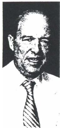
Ενα ολιγομέλές κλαμπ πανίσχυρων κατασκευαστικών εταιρειών φαίνεται να θέλει ο Κώστας Σημίτης.