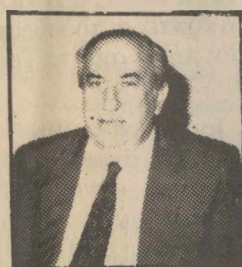
Νομάρχης Ηρακλείου: «Εγιναν ασκήσεις»

Παρόλα αυτά θα πρέπει να επαναλάβουμε ότι υπάρχουν και εδώ σχέδια εκτάκτου ανάγκης, που θα τεθούν σε εφαρμογή αν χρειαστεί από