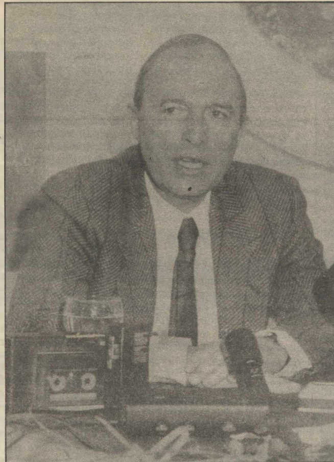
Ο κ. Κ. Σημίτης κατά την χθεσινή συνέντευξη Τύπου στο «Γκάλαξυ»

Η αντιμετώπιση των μαθητικών κινητοποιήσεων έδειξε έλλειψη ευαισθησίας. Στη συνέχεια, με τον προγραμματισμό των ανακαταλήψεων, τη χρήση βίας, τον αυταρχισμό,