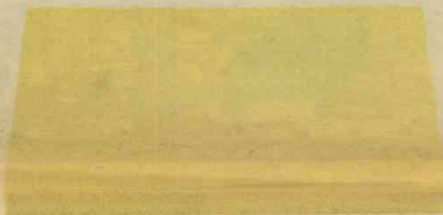
Notes Post-it™ classiques.

Il n'y a aucune différence entre ces Notes Post-it.™