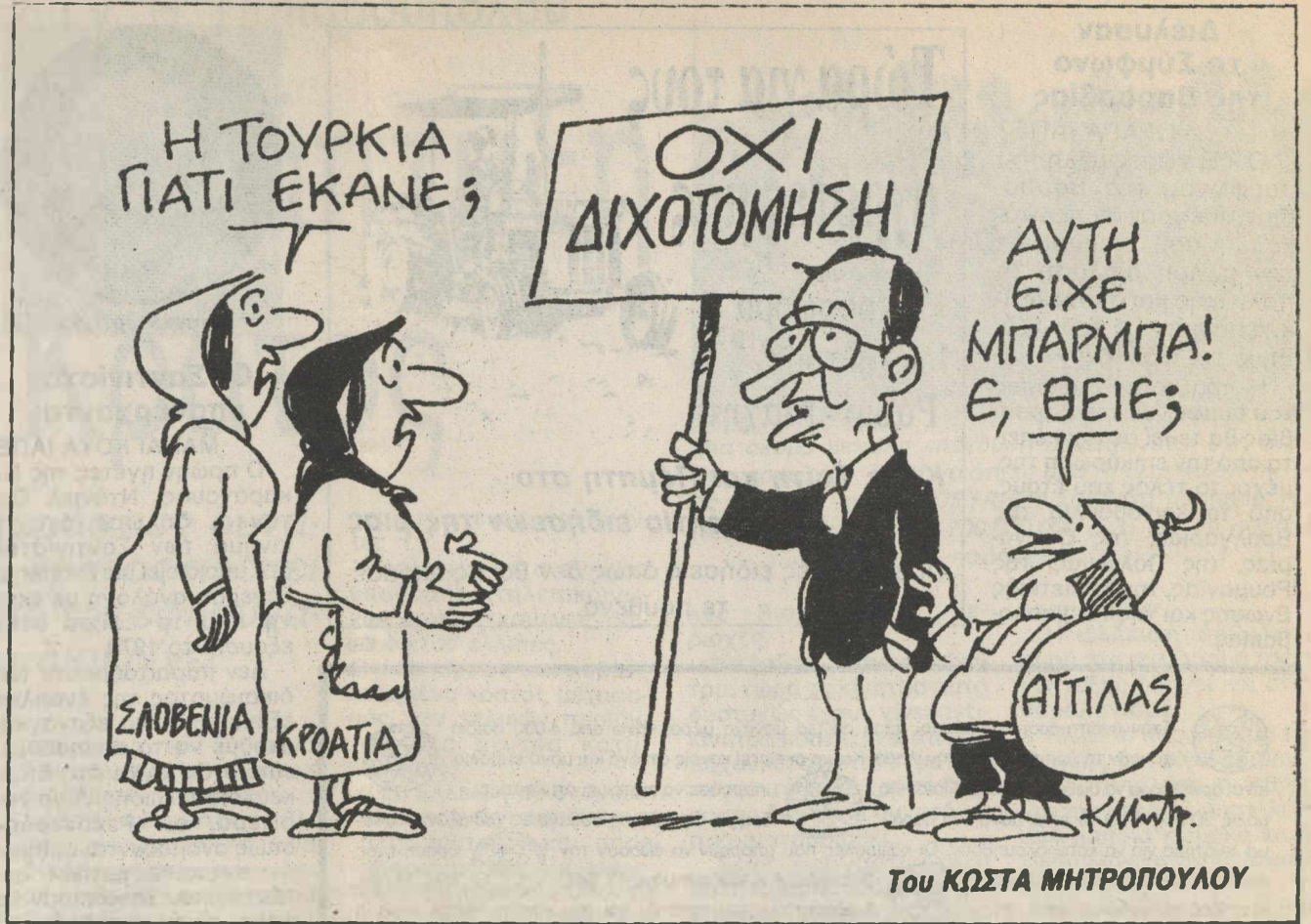
Του ΚΩΣΤΑ ΜΗΤΡΟΠΟΥΛΟΥ

Οπου νάναι θα αλαφρυνθούν και οι επενδυτές της ΒΙΠΕ.