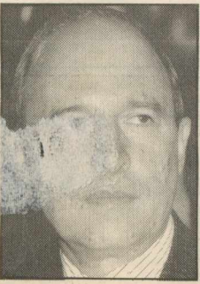
Του ΚΩΣΤΑ ΣΗΜΙΤΗ