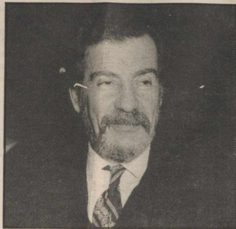
Το 64,2% των ψήφων συγκέντρωσε ο Γιώργος Γεννηματάς στην Α' Αθήνας!

απαρχή μιας πανεθνικής προσπάθειας για την αναγέννηση της χώρας. Για μια Ελλάδα