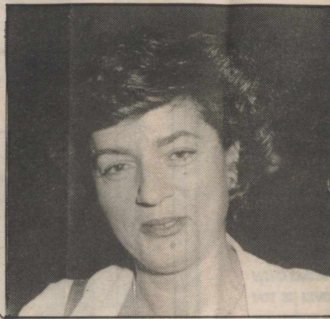
Ότι θα ξεπεράσει τους 200.000 σταυρούς εκτιμούν για την Βάσω Παπανδρέου στην Β' Αθηνών!

ναίκες και άνδρες, της Β' Περιφέρειας Αθηνών, για την τιμή που μου έκαναν και την εμπιστοσύνη με την οποία με περιέβαλαν.