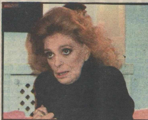
Το υπουργείο Πολιτισμού απαιτεί η κα Μερκούρη.