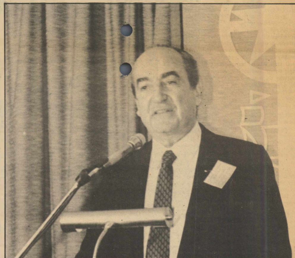
Σκληρή για το ΠΑΣΟΚ ήταν η χθεσινή ομιλία του προέδρου της Ν.Δ. κ. Κώστα Μητσοτάκη στην Α' περιφερειακή συνδιάσκεψη του κόμματος στα Χανιά

Υπό τις παρούσες συνθήκες, καταλήγει η κ. Λιοΐς, οι Ηνωμένες Πολιτείες θα πρέπει να κρατηθούν σε απόσταση. Δεν υπάρχει λόγος, επισημαίνει, ούτε να καταπνίξουμε τις ύβρεις, αλλά ούτε και να πανικοβαλόμεστε. Ο,τιδήποτε κι αν συμβαίνει στην Ελλάδα, το πιο πιθανό είναι να αποδοθεί σε φταίσιμο της Αμερικής.