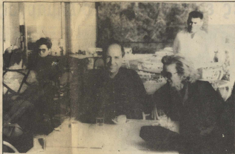
Ο κ. Σημίτης στο τουριστικό περίπτερο του επαρχείου

Ξαφνικά (και άνευ λόγου συγκεκριμένου) έκανε την εμφάνισή του χθες στον Πύργο ο πρώην υπουργός Εθνικής Οικονομίας Κώστας Σημίτης. Μαζί με τη γυναίκα του και με φιλική του παρέα απόλαυσε το ελληνικό καφεδάκι του (αν ήταν πικρό δεν μάθαμε) τον ήλιο και τη θέα από το Τουριστικό Περίπτερο του Επαρχίου. Λιτός (όπως και η πολιτική του) μόνο πολύ πίο γελαστός απ' ότι τον είχαμε συνηθίσει ως υπουργό. Παρόλες τις ερωτήσεις μας (πλαγίως άμα και ευθέως) ουδέν μας είπε εκτός του ότι βρέθηκε ιγκόνιτο στον Πύργο και κατευθύνεται προς Αρχαία Ολυμπία. Αμέσως μετά θα γύριζε στο σπίτι του για να γιορτάσει «οικογενειακά την Πρωτοχρονιά». Δηλαδή επιμέναμε «τώρα μόνο διακοπές κάνετε;» Και η απάντηση «Φυσικά, όχι μόνο διακοπές! Αλλά είδηση δεν θα βγάλετε! Εξάλλου αφού με ανακαλύψατε εδώ, εξασφαλίσατε ήδη μιά αποκλειστικότητα!» Σαφώς και ουδείς πίστεψε ότι ο κύριος Σημίτης από της