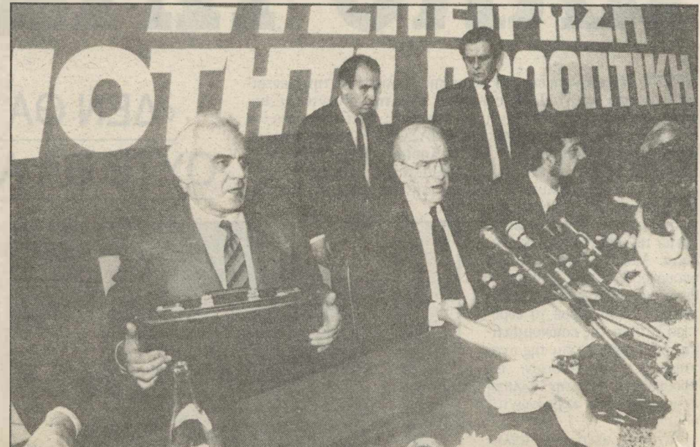
Από τη σύνοδο της Κ.Ε. του ΠΑΣΟΚ.

«Η δική μας γραμμή είναι μονομετώπη γιατί έζορουμε που βρίσκειται η διαχωριστική γραμμή: Πρόοδος - Συντήρηση. Δεν είμαστε σε ίση απόσταση