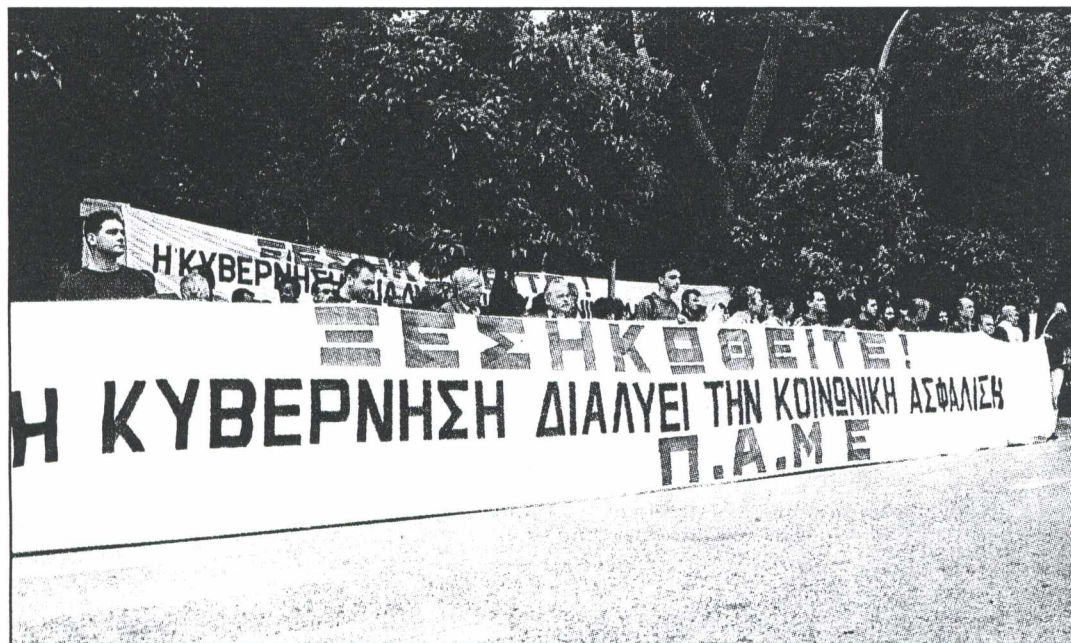
Τα κυβερνητικά σχέδια κινητοποιούν αλλά και αναγκάζουν τις παρατάξεις σε ουσιαστικές συγκλίσεις