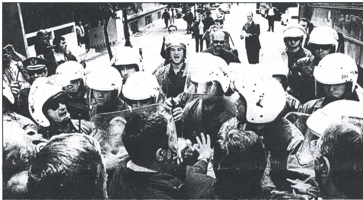
Κοινωνικές εντάσεις θα πυροδοτήσουν οι παραλογισμοί του λεγόμενου νέου ασφαλιστικού συστήματος

1 Η εισήγηση αναφέρει ότι διά των (εισπρακτικών) μέτρων εξοικονομούνται 21 τρισ. δρχ. τα επόμενα 25 έτη, διάστημα κατά το οποίο το αναλογιστικό έλλειμμα, σύμφωνα με τις επεξεργασίες των μελετητών της Government Actuary's ανέρχεται στα 120 τρισ. δρχ. Υπό αυτά τα δεδομένα και αν ο προϋπολογισμός συνεχίζει να χρηματοδοτεί το σύστημα ακόμη και με 2 τρισ. ετησίως, όσα κατά τους Βρετανούς εκταμιευτήκαν το 2000 για τις συντάξεις των δημοσίων υπαλλήλων (0,7 τρισ.) και αποδοθηκαν στα άλλα ταμεία (1,3 τρισ.), σημαίνει ότι το αναλογιστικό έλλειμμα παραμένει περί τα 50 τρισ. δρχ. Αυτή η παραδοχή, στις προτάσεις Γιαννίτση, αποκαλύπτει ότι οι σκληρές παρεμβάσεις αφενός στερούν αναμενόμενες παροχές από τους