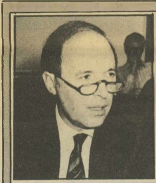
Ο κ. Κ. Σημίτης