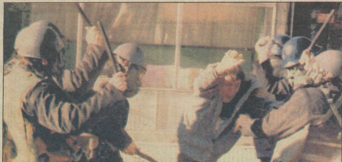
Σε λουτρό αίματος εξελίσσεται ο εμφύλιος στη Γιουγκοσλαβία. Είκοσι ένας άνθρωποι έχασαν τις δύο τελευταίες ημέρες τη ζωή τους (19 διαδηλωτές - 2 αστυνομικοί) σύμφωνα με το πρακτορείο «Τανγιούγκ», ενώ οι φήμες θέλουν τον αριθμό των θυμάτων να πλησιάζει τους 100. Οι συγκρούσεις - πολλές φορές ένοπλες - έχουν εξαπλωθεί σε όλο το Κοσσυφοπέδιο. Η φωτογραφία είναι από τις τελευταίες συγκρούσεις. ΣΕΛ. 17