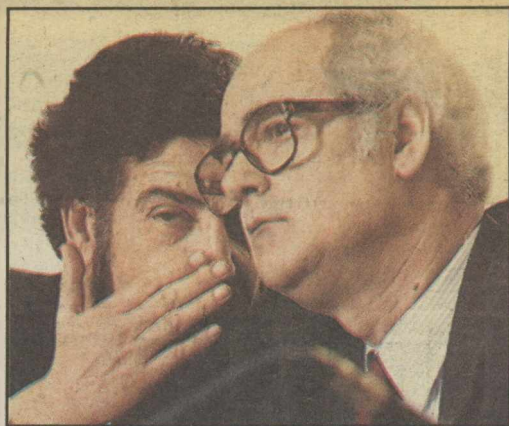
Μιλώντας σε συγκέντρωση συνδικαλιστών στο «Σπόρτιγκ», υπό τους ήχους αντάρτικων τραγουδιών («Βροντάει ο Ολυμπος» κ.α.) εξέφρασαν βεβαιότητα για αυτοδυναμία, αλλά έκαναν και άνοιγμα στην Αριστερά. Δεν είπαν τίποτα για Μένιο, αλλά μίλησαν αόριστα για κάθαρση, ενώ το πλήθος κραύγαζε «Κάτω η χούντα στη Δικαιοσύνη». ΣΕΛ. 4

ΠΥΡΙΝΕΣ ΟΜΙΛΙΕΣ Κατά δικαστών Γεννηματάς και Κακλαμάνης