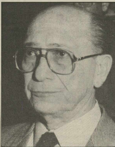
Μαγκάκης. Πολιτική κίνηση η υπογραφή!

Προβλέπει άλλη διαδικασία συζήτησης στη Βουλή. Επειδή όλοι οι Έλληνες είναι ίσοι απέναντι στο νόμο, η διαφορετική μεταχείριση των πολιτών πρέπει να περιορίζεται όσο είναι δυνατόν. Επειδή δεν είναι