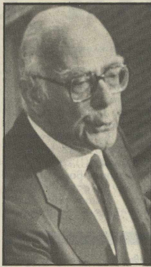
Ο Γ. Ράλλης

«Εκτός των ρυθμίσεων που έχει εξαγγείλει η κυβέρνηση, για την παραχώρηση τηλεοπτικού χρόνου στα κόμματα και τις νεολαίες και που αφορούν, το μεσοδιάστημα από σήμερα μέχρι και την επίσημη προκήρυξη των εκλογών, αποφάσισε να καλύψει η ΕΡΤ για τον μήνα Απρίλιο, δύο υπαίθριες συγκεντρώσεις, που θα θελήσει να πραγματοποιήσει κάθε κόμμα. Ο χρόνος κάλυψης θα είναι ανάλογος με την κοινοβουλευτική εκπροσώπηση του κάθε κόμματος και όχι μικρότερος των δέκα λεπτών. Για όλες τις περιπτώσεις αυτές, ο φωτισμός του κυρίου χώρου της συγκέντρωσης και τα άλλα έξοδα θα βαρύνουν την ΕΡΤ».